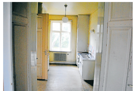
En tur i det förgångna finns på Första Avenyen 18.