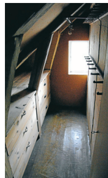
En skrubbd modell äldre.