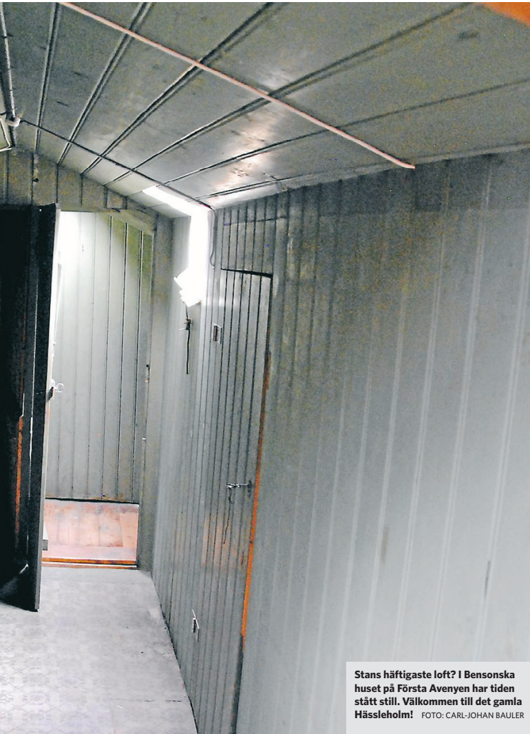
Stans häftigaste loft? I Bensonska huset på Första Avenyen har tiden stått still. Välkommen till det gamla Hässleholm!