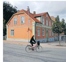
Bensonska huset på sin hörna ända sedan 1894-95.