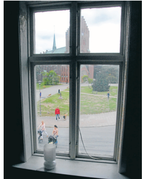
En utsikt mot Kyrktorget mycket få kan skryta med.