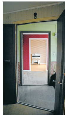
Rum följer på rum